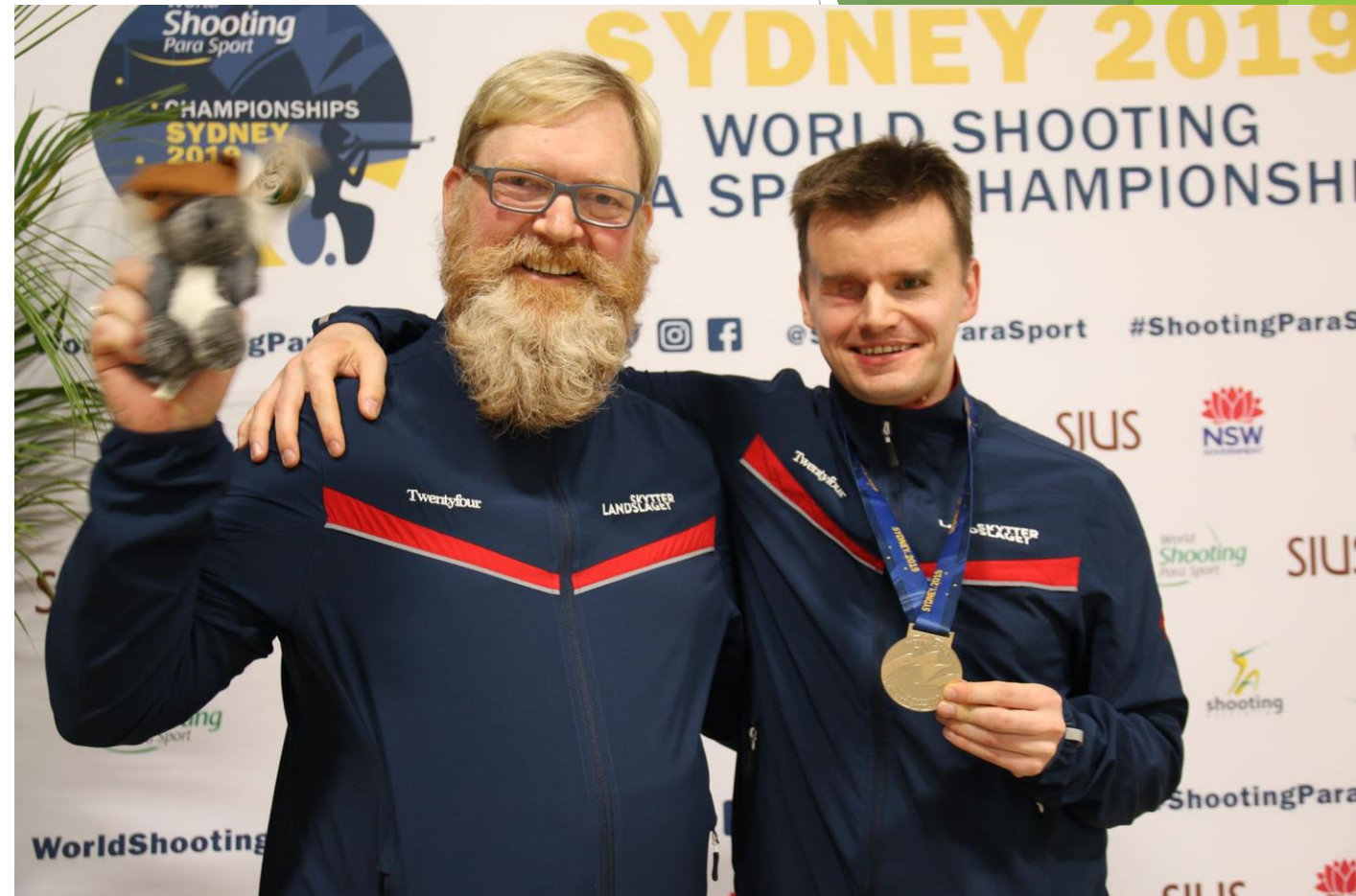
Sølvmedalje rundt halsen på utøveren etter iherdig innsats i VM 2019 i Sydney / Australia. Assistenten måtte nøye seg med en liten Koala